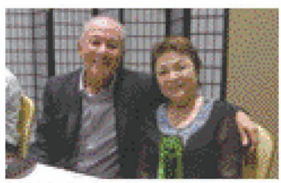
ホノリル、レストランにて

衆酒場で飲んでいたら世界中が驚きます。首相が庶民と同じである必要はなく、リーダーの仕事は遂行することが任務です。アメリカには高等教育を受ける者は社会のリー