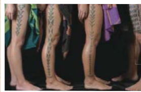
タトゥー・ホノルル展のポスター写真