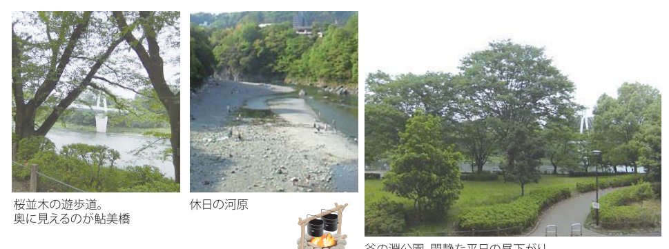
桜並木の遊歩道。奥に見えるのが鮎美橋 休日の河原 釜の淵公園。閑静な平日の昼下がり