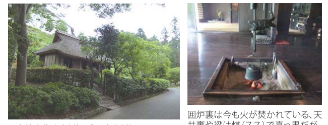
旧宮崎家住宅(建物:重要文化財)もとは青梅市成木にあった江戸中期の農家を昭和54年に現在地に移築復元した。屋根は杉の皮と茅を交互に葺く、トラ葺き。 囲炉裏は今も火が焚かれている。天井裏や梁は煤(スス)で真っ黒だが、煤には防虫効果があるという。